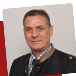
Erich Riegler, ÖBV-Präsident

„Der ÖBV vertritt 108.162 aktive Musiker in Österreich. Als Serviceeinrichtung stehen wir auch unseren Partnerverbänden Südtirol und Liechtenstein zur Verfügung. Für die 2.167 Musikvereine spielen auch gesetzliche Bedingungen eine zentrale Rolle. Zum Thema Datenschutzgrundverordnung ist den Beilagen des Bundesrundschriftens eine rechtliche Information über das „Veröffentlichen von Bildern“ zu entnehmen. Bitte um Kenntnisnahme!“