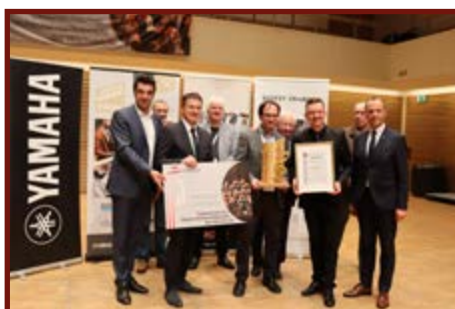
Bläserphilharmonie Kärnten (Höchststufe)