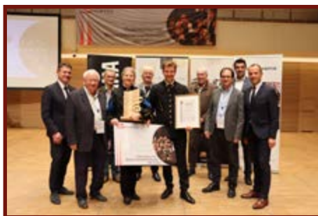
voestalpine Blasorchester (Stufe E)