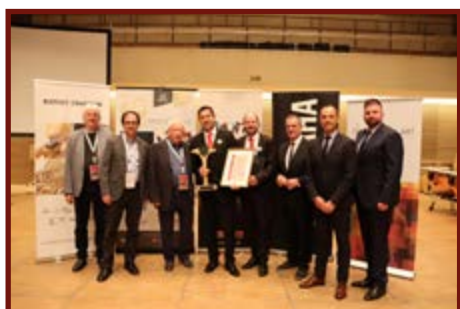
Brass Band Oberösterreich