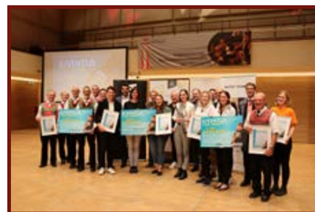
JUVENTUS MUSIC AWARD