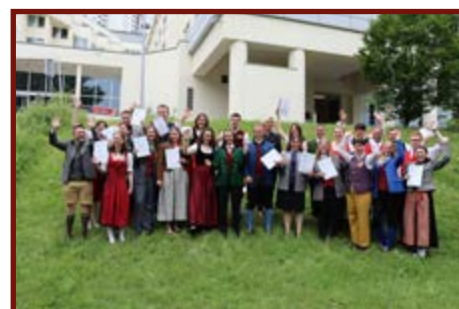
Absolventinnen und Absolventen der Lehrgänge