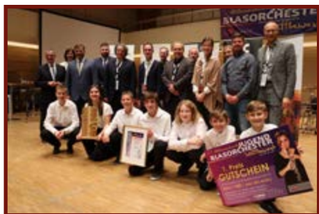
Landeck Wind - Das Jugendblasorchester der LMS Landeck (Stufe CJ)