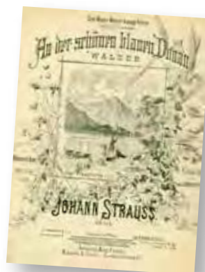
Titelblatt Donauwalzer 1867