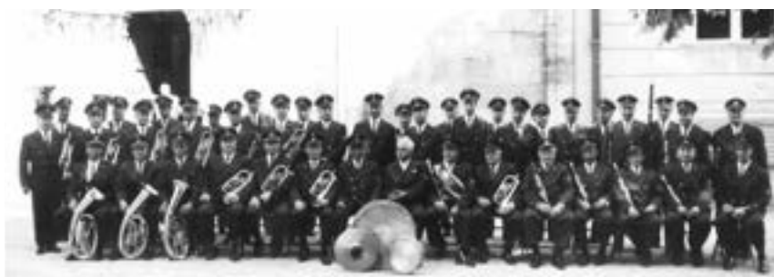
Kurkonzert 1968, Baden

INFOS www.bezirksmuseum.at/de/bezirksmuseum_11/ausstellungen www.wienernetze.info facebook.com/wienernetzeorchester