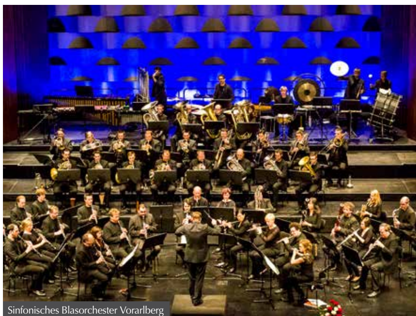
Sinfonisches Blasorchester Vorarlberg