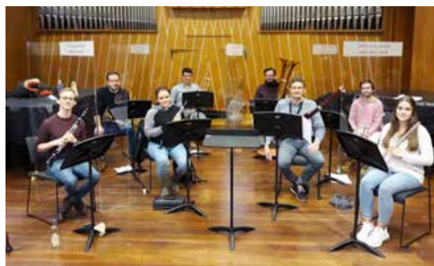
Die Abschlussprüfung des 20. Studienganges Blasorchesterleitung

großem Gewinn absolviert. Profiteure sind dabei ganz besonders die Musikkapellen, die von den neu gewonnenen Fähigkeiten ihrer Leiter inspiriert und positiv weiterentwickelt werden. Dieser Kurs verfolgt das