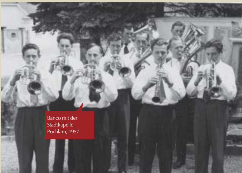
Banco mit der Stadtkapelle Pöchlarn, 1957