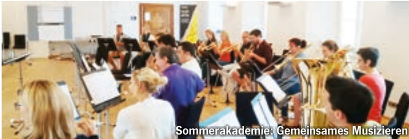
Sommerakademie: Gemeinsames Musizieren

unterricht in einer Bläserklasse. Die einzelnen Lektionen sind so aufgebaut, dass die Kinder langsam an die instrumentenspezifischen Entwicklungsstufen herangeführt werden. Ergänzungen können leicht integriert werden, was einen individualisierten Instrumentalunterricht ermöglicht, besonders für begabte Schülerinnen und Schüler und die, die speziell gefördert werden müssen, um dem Lerntempo der Gruppe folgen zu können.