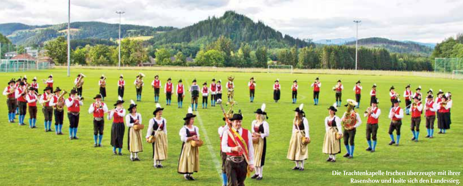
Die Trachtenkapelle Irschen überzeugte mit ihrer Rasenshow und holte sich den Landessieg.