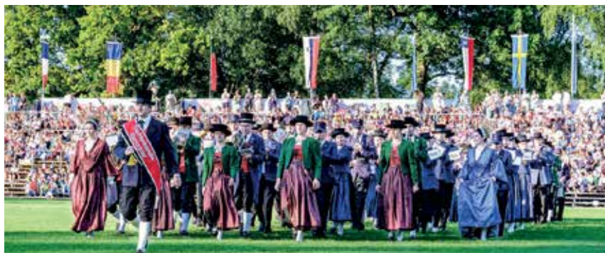
Weillgymnaestrada 2019