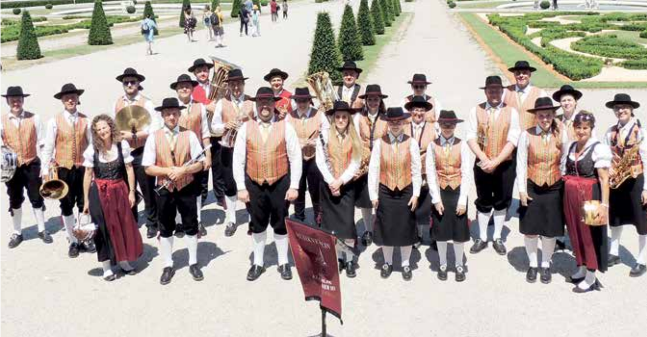
Der Musikverein Möchling-Klopeiner See und die Marktkapelle Eberndorf-Kühnsdorf vertreten heuer Kärnten beim Blasmusikfest in Wien.