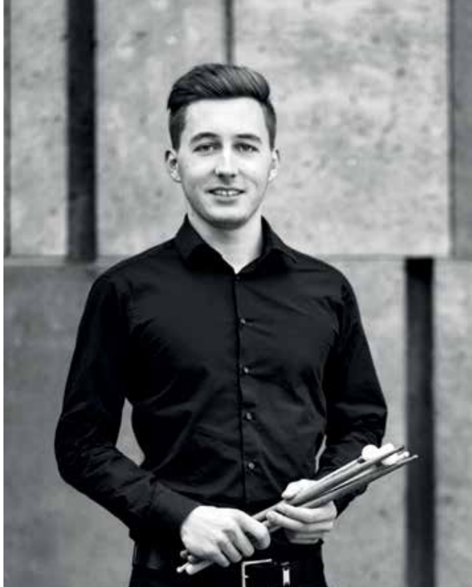
Oberösterreichische Komponisten im Porträt