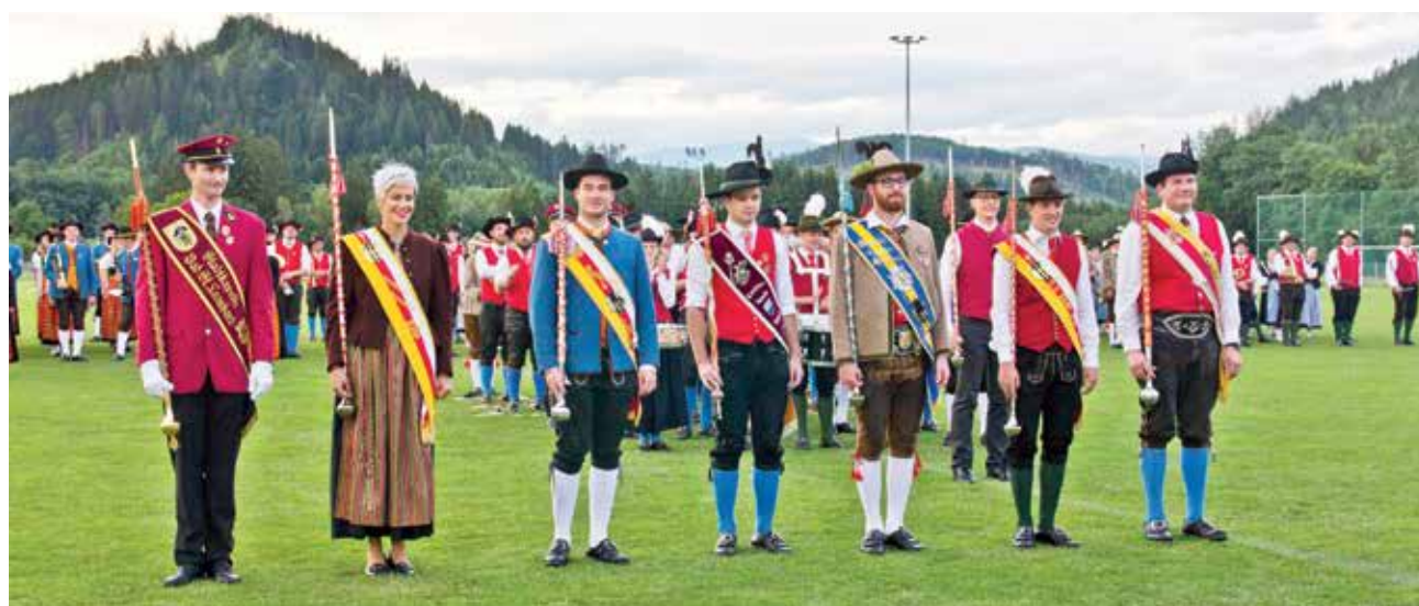
Die erfolgreichen Stabführer des Landeswettbewerbes „Musik in Bewegung“.